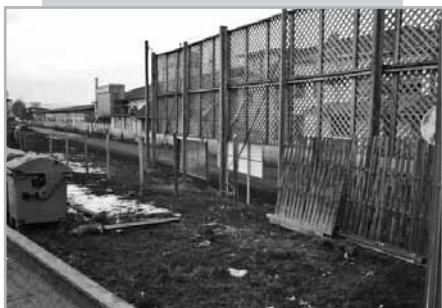
A tervezett bejárót csatlakozásának helye