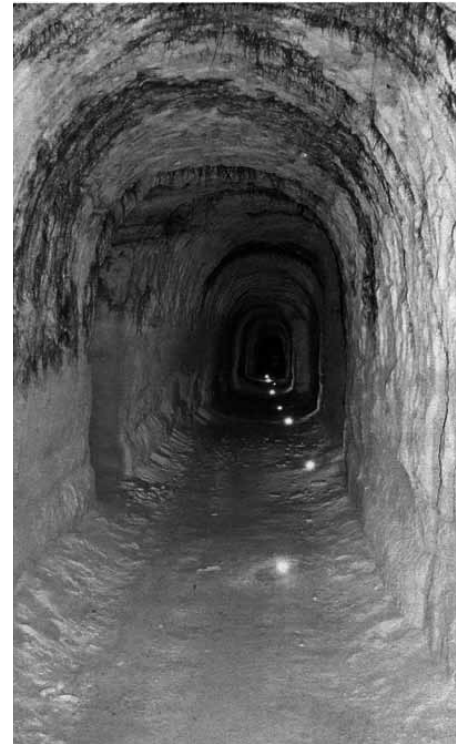
Piktorziegelgrube in Wudersch