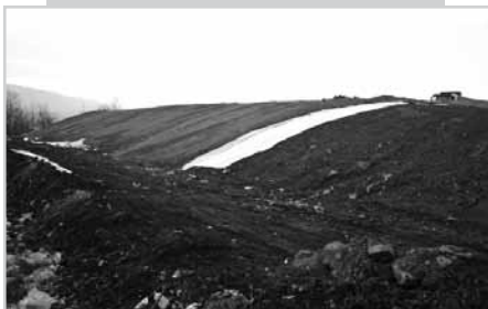
A szomszédos ingatlanon folyamatban a rekultiváció