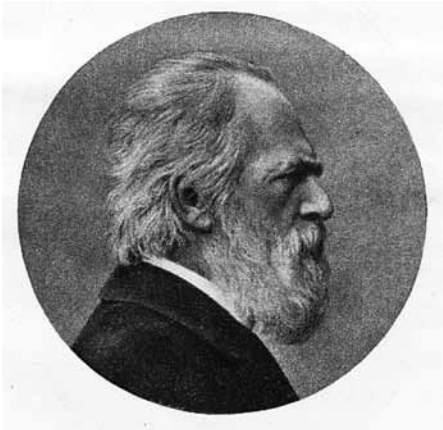
Hermann Carl Usener (1834-1935) német filológus és vallástörténész

H ermann Carl Usener, a XIX. század híres német vallástörténésze a gyertyaszentelés hagyományát a keresztények előtti római korból eredeztette, a rómaiaknál a február hónap ugyanis a megtisztulás és a bűnbánat ideje volt. A katolikus egyház ezen a napon Mária megtisztulását és Jézus templomban való bemutatását ünnepli. Ezáltal ez a nap különösen a nők és a gyermekágyas asszonyok számára bír nagy jelentőséggel.