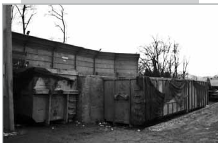
A meglévő hulladékátrakó